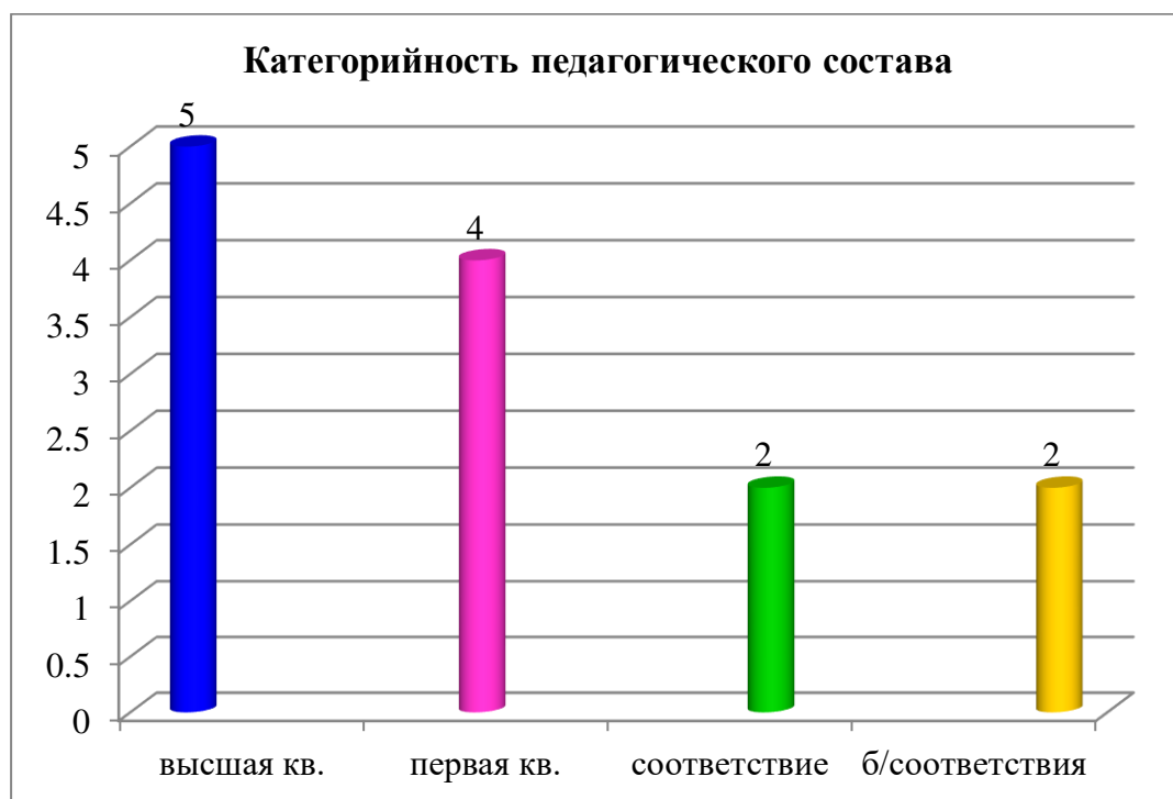
Диаграмма с характеристиками кадрового состава

- 1 педагог по теме "Особенности деятельности музыкального руководителя ДООУ в соответствии с ФГОС дошкольного образования".