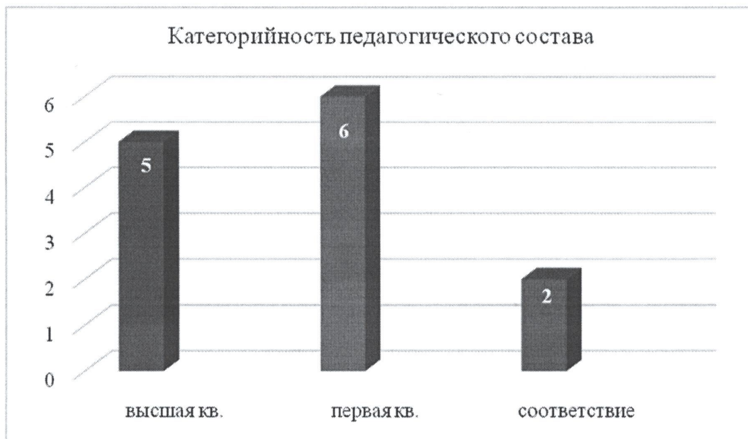
Диаграмма с характеристиками кадрового состава

Курсы повышения квалификации в 2019 году прошли 5 педагогов и переподготовку - 1 воспитатель.